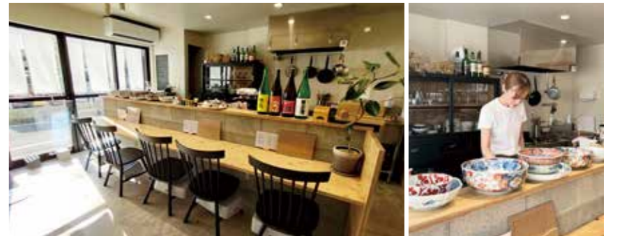
シンプルな内装。カウンター5席にテーブル席3席。人数によっては貸切可

美味しいおばんざいを肴に、こだわりの日本酒をゆっくり味わいたい。そんな時におすすめのお店です。