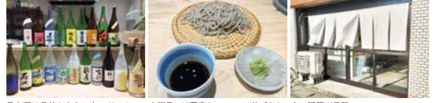
日本酒は県外を中心に辛口がメイン。土曜日には蕎麦もメニューに並びます