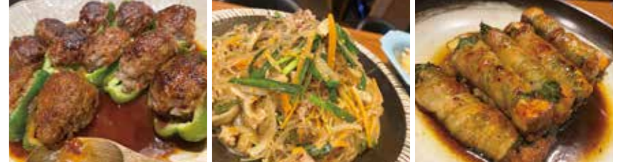
おばんざいの一例

[INFORMATION] さけとアテ ちゆき ☎なし(お問合せはインスタのDMで) ●佐賀市愛敬町2-20 ●営業時間/月~金曜18:00~24:00