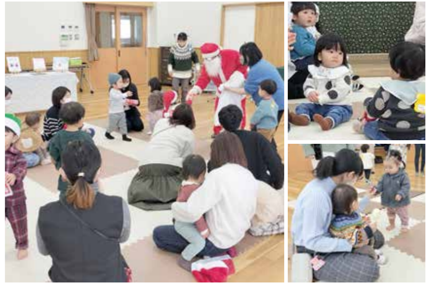
季節の行事の様子(写真は12月のXmasイベント)。会場に子ども達の笑顔がいっぱい広がっていました

[INFORMATION] 子育てサロン「かんこうドーナツ」 ●問い合わせ ☎0952-24-7715 (担当:鶴丸さん) ●会場/勤興公民館大会議室 ●開催時間/10:15~12:00 ●運営方法/ボランティアスタッフ ●参加費/1家族100円(月1回徴収、空調、文具など使用) ●対象/0歳~就園前の乳児・幼児・保護者 ※育児中の「パパ」も大歓迎のこと!