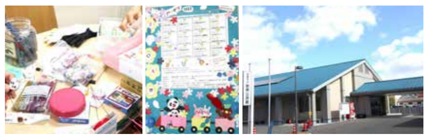
スタッフさんが心をこめながら手づくりでおもちゃ作りを準備 入口そばに貼られている青い屋根が自印の勤興公民館。明るく開放的な年間スケジュールも親子 空間ですみやすい雰囲気