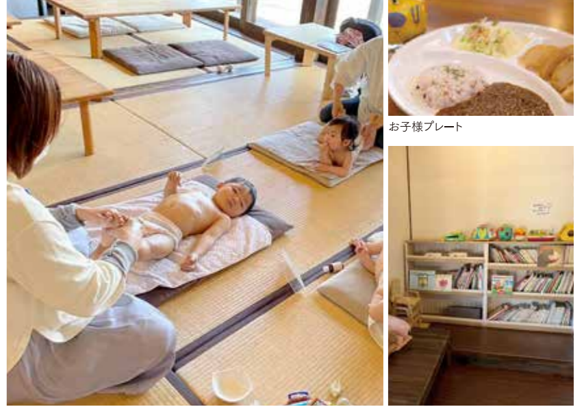
ベビーマッサージ教室の一コマ

[INFORMATION] ものづくりカフェ こねくり家 ☎0952-37-6905 ●佐賀市柳町4-16(旧久富家住宅) ●営業時間/平日11:30~15:00、土・日曜、祝日11:30~17:00 ※ランチメニューは14:30ラストオーダー ●定休日/月曜・毎月最終火曜 ●駐車場/あり(佐賀市歴史民俗館駐車場) ●Instagram @conekuriya