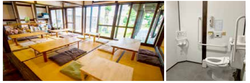
座敷スペースは特に週末は人気!事前予約がおすすめ