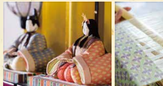
佐賀錦のおひなさま

伝統工芸手織り佐賀錦は、経糸(たていと)に金銀漆など で加工し、細く裁断した和紙を用い、緯糸(よこいと)には、 色鮮やかに染色した専用の絹糸を用います。大正期に建て られ、当時の建築技術の粋を集めた近代和風建築の旧福田 家では、手織り佐賀錦をまとった絢爛豪華な雛人形を展示し ます。また、会場では製作実演が行われ、製品のお買い物 もできます。