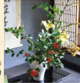
佐賀市文化連盟の生け花